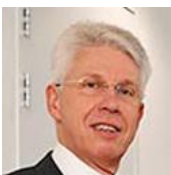
Chief Operating Officer (COO)