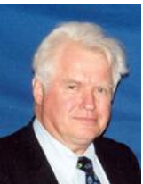
Emeritus hoogleraar TU Delft